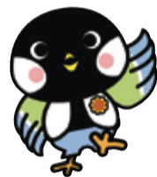
港南区ひまわり交流協会のマスコットキャラクター「区の鳥シジュウカラ[ティットくん]」

今年も、ひまわりを通して交流を行っている宮城県大崎市から届いたひまわりの種を皆さんに配布します。たくさん咲かせて、港南区のまちをもっと明るく元気にしましょう。