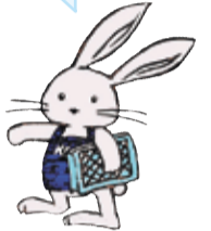
港南図書館 マスコットキャラクター こうなんうさぽん